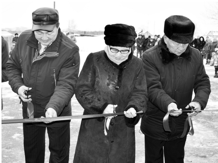
Управление образования Бай-Тайгинского кожууна