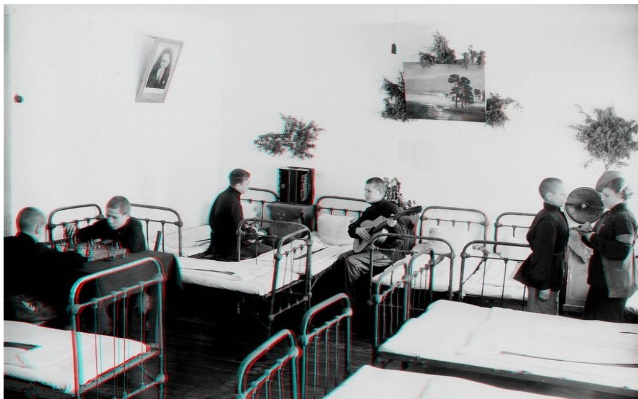
Фото 13. Комната в общежитии. 1942 год.