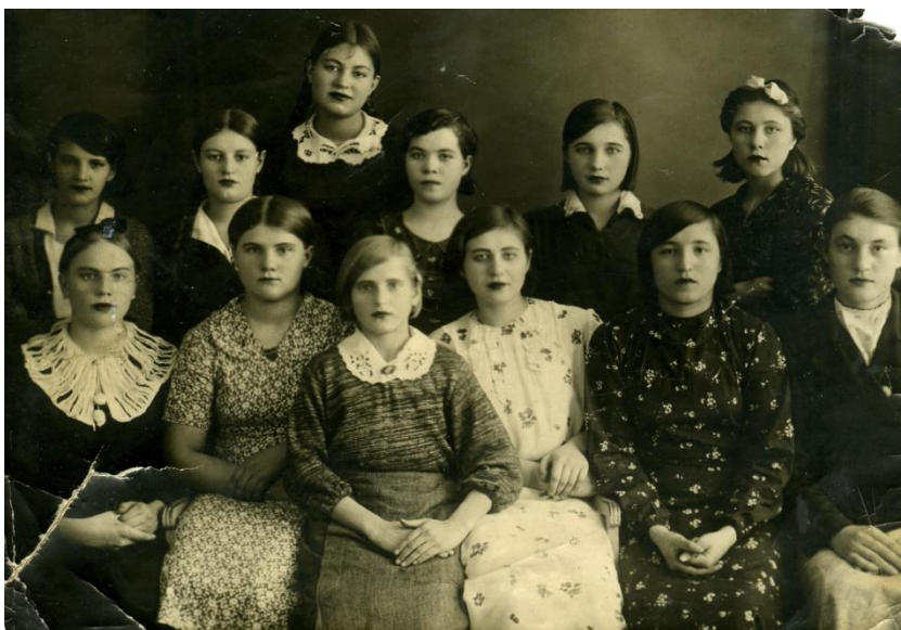
Фото 17. Выпуск. 1943 год.

педагогов направили в Юргинский район на уборку урожая. Пришлось вязать снопы ржи и пшеницы, доставлять на элеватор. Жили в очень трудных условиях целый месяц. Приступили к учебе в октябре. Учились старательно, старались запомнить материал. Тетрадей не было, писали на старых журналах, с собой носили пузырек с чернилами.