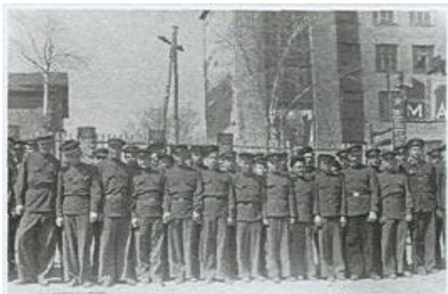
Фото 5. Ученики техникума. 1944 год

Для обеспечения учебных заведений квалифицированными кадрами в 1943 – 44 гг. было открыто четырнадцать индустриальных, два железнодорожных и один физической культуры техникумов ( фото 5. ) с большим числом учащихся (2730 человек из выпускников школ ФЗО и училищ).