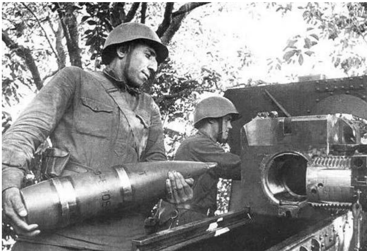
Фото 14. Победа будет за нами! 1942 год.

Починок Смоленской области, определили в артиллерийский полк подносчиком снарядов 120мм пушки.(фото 14.)