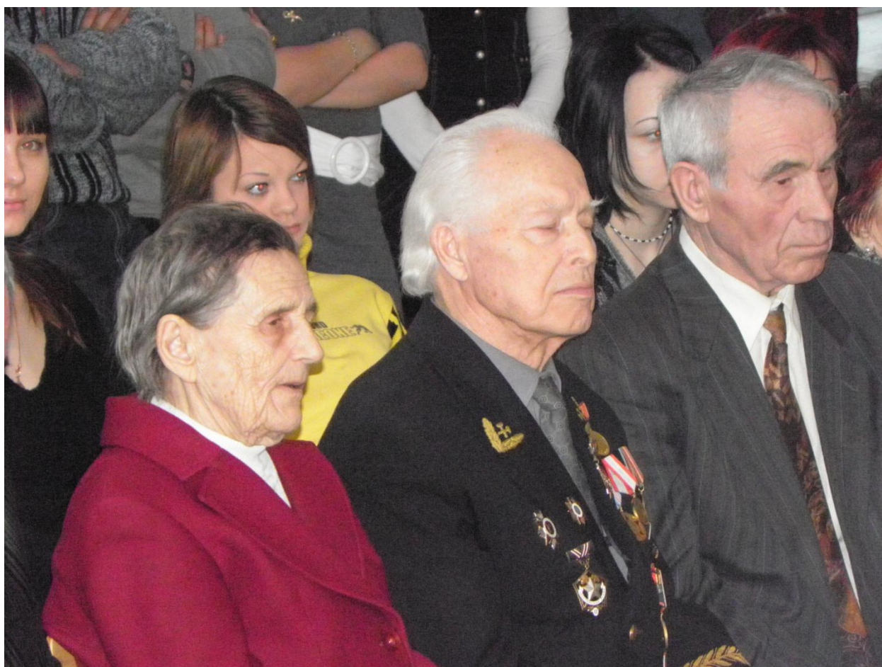
Фото 15. Встреча с учащимися ПЛ №18. 23 февраля 2010 год.

Общий трудовой стаж с учётом военной службы 62 года, из них последние 11 лет трудился в профессиональном лицее № 18. В настоящее время почётный гость встреч с учащимися.(фото 15.) На уроках мужества ветеран делится воспоминаниями о годах учёбы и участия в боях с немецкими и японским захватчиками.