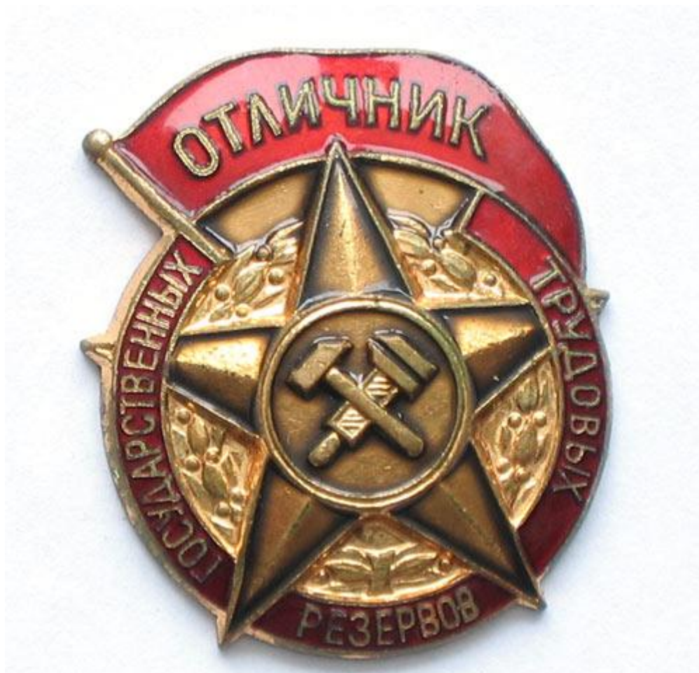
Фото 6. Знак «Отличник государственных трудовых резервов»

За успешную работу по подготовке кадров и производству продукции, имеющей оборонное значение, многие работники системы трудовых резервов награждались орденами и медалями, значками «Отличник государственных трудовых резервов» (фото 6.) и значками наркоматов.