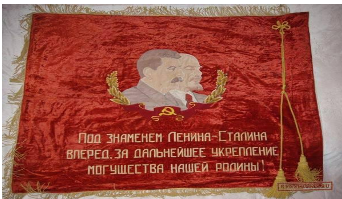
Фото 8. Переходящее Красное Знамя. 1944 год

дисциплине, порядке и организованности в работе школ ФЗО, РУ и РЖ в условиях Отечественной войны». Эти собрания имели мобилизующие значения для перестройки всей работы на военный лад. Преподаватели и мастера принимали на себя обязательства коренным образом улучшить производственно – техническое обучение учащихся и военно – патриотическое воспитание молодежи. Учащиеся проявили свое горячее желание и решимость отдать все силы и знания общенародному делу – разгрому фашистских захватчиков. Они понимали значимость труда в тылу для победы на фронте. Это они, молодые, пришли в бригады на смену тем, кто ушел на войну защищать Родину. Лозунг: «В труде, как в бою» выражал общий настрой трудящейся молодежи, работавшей не щадя своих сил, самоотверженно, высокопроизводительно. Тысячи подростков включились в борьбу за увеличение производства боеприпасов и вооружения под девизом: «Выполним фронтовой заказ досрочно!». Организованное соревнование развивало у молодежи чувство ответственности перед Родиной. Главное управление трудовых резервов и ЦК ВЛКСМ организовали в 1942 году Всесоюзное социалистическое соревнование училищ и школ ФЗО. Государственный комитет обороны СССР учредил переходящее Красное Знамя. (фото 8.)