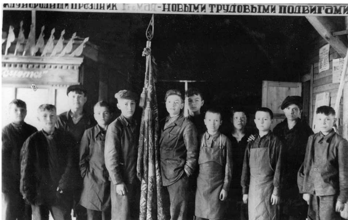
Фото 7. Победители по выпуску продукции для фронта. 1944 год

Выполнение государственных заказов на изготовление военной продукции вызвало среди учащихся, преподавателей и мастеров учебных заведений трудовой подъем (фото 7.).