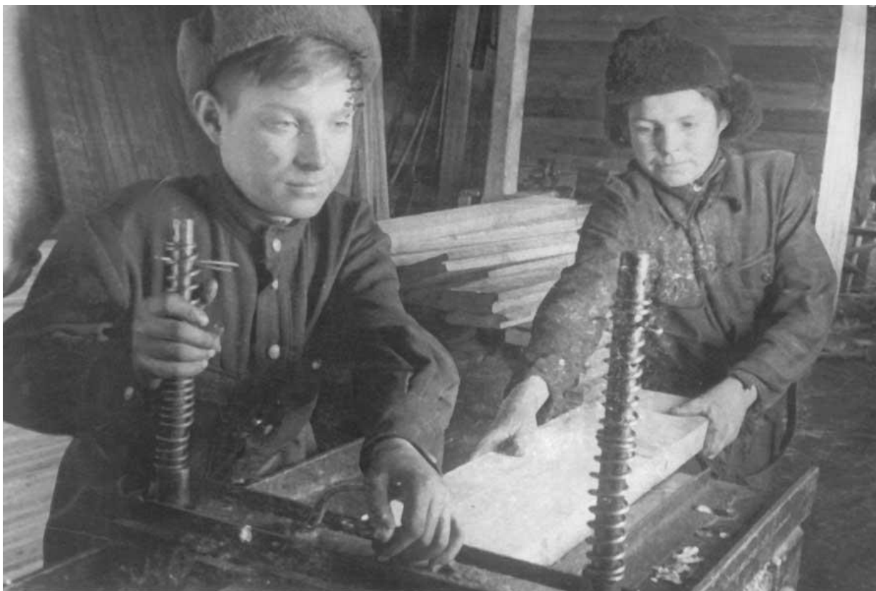
Фото 3. Ученики ремесленного училища. 1943 год

В годы войны создаются новые типы учебных заведений. В 1943 году в системе трудовых резервов создаются ремесленные училища и школы ФЗО по подготовке квалифицированных кадров для машинно – тракторных станций (МТС), мастерских и ремонтных заводов Наркомзема СССР, для совхозов. Таким образом, в годы Великой Отечественной войны в Кузбассе развивается и совершенствуется сеть учебных заведений по подготовке специалистов народного хозяйства (фото 3.).