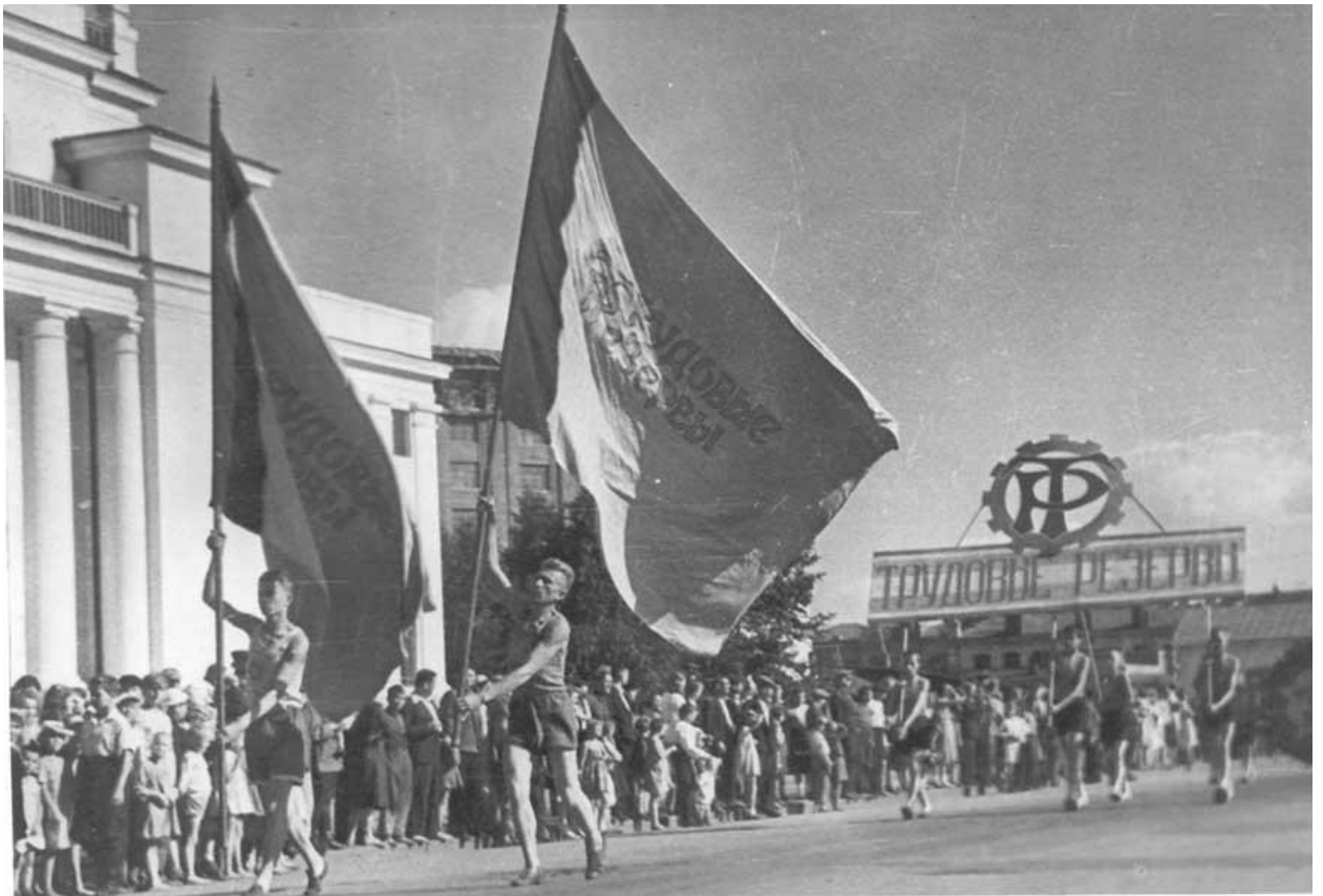
Фото 11. Знамя спортивного общества «Трудовые резервы». 1944 год

Это общество способствовало улучшению военно – физической подготовке учащихся. В Кузбассе подготовлены тысячи значкистов ГТО. Таким образом, учебные заведения трудовых резервов Кузбасса в трудных условиях войны готовили всесторонне развитых рабочих. (фото 11.)