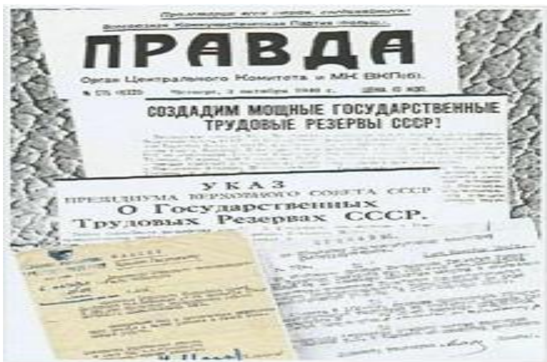
Фото 1. Газета «ПРАВДА» от 2.10.1940

Великая Отечественная война явилась суровым испытанием для новой системы подготовки квалифицированных рабочих, созданной 2 октября 1940 года (фото 1.).