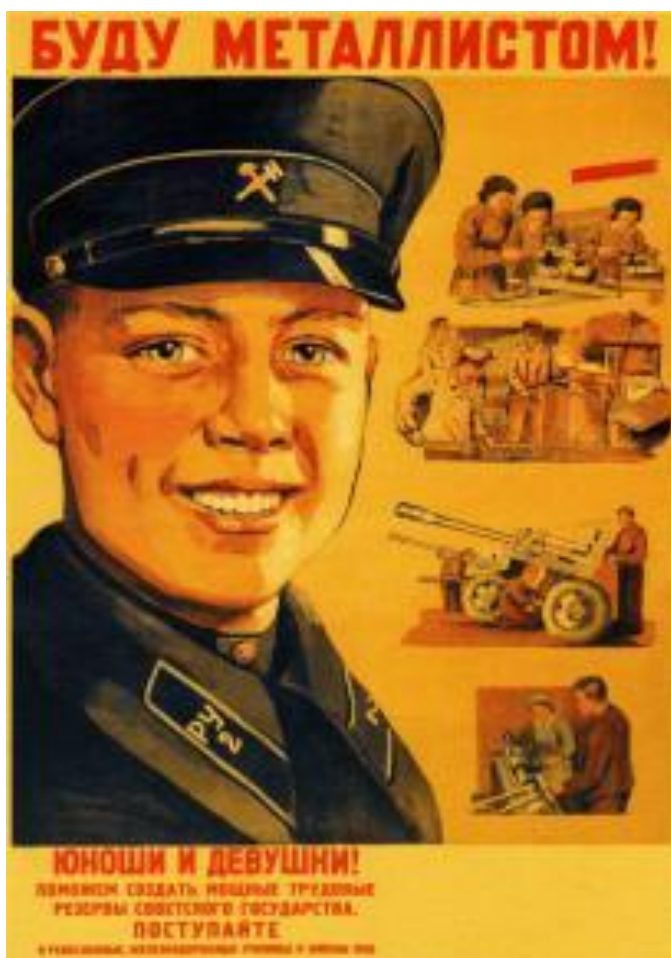
Фото 2. Плакат «Трудовые резервы» 1941 год

В Сибирь эвакуировано около 400 промышленных предприятий, много строительных трестов вместе с рабочими. В Кузбасс прибыли предприятия и учреждения из Донбасса, однако, рабочих среди них было мало. Необходимо было на местах привлекать на предприятия рабочих, проводить их профессиональную подготовку. Подготовка рабочих кадров велась на курсах, в стахановских школах, через шефство опытных рабочих над молодыми, индивидуально – бригадное обучение.