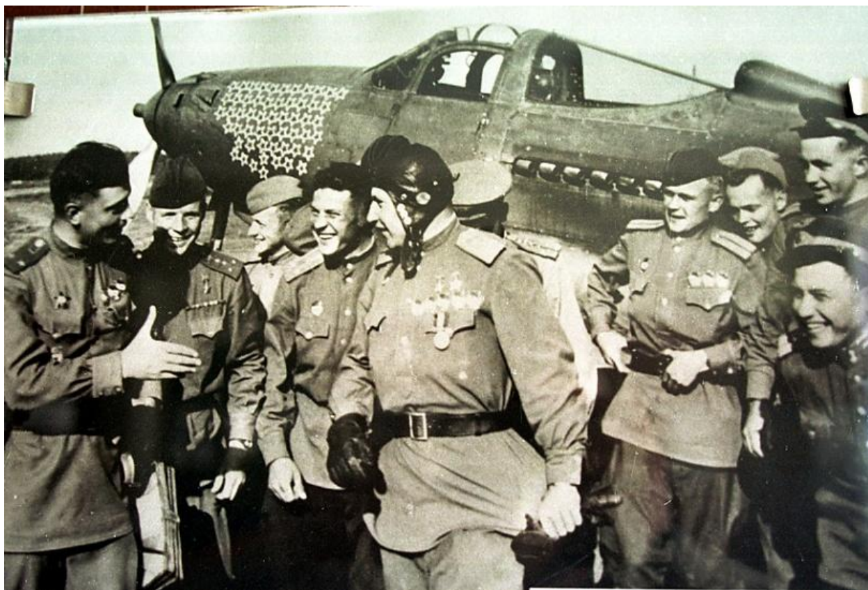
Фото 12. А.И.Покрышкин (в центре) в кругу друзей. 1943 год.

Трудовые резервы Кузбасса и всей Сибири оказывали помощь в восстановлении разрушенного хозяйства. Из училищ и школ ФЗО Кузбасса на восстановление Донецкого угольного бассейна было направлено 1000 учащихся. Учащиеся Кемеровской области отправили в Ворошиловоградскую и другие области оборудование, инструменты и культинвентарь на сумму 222 тыс. рублей. Многие выпускники учебных заведений трудовых резервов отличались на фронтах Великой Отечественной войны. В начале войны 250 лучших учащихся ремесленного училища № 1 Новосибирска ушли добровольцами на фронт. Трижды Героем Советского Союза стал бывший воспитанник этого училища А.И. Покрышкин. (фото 12.)