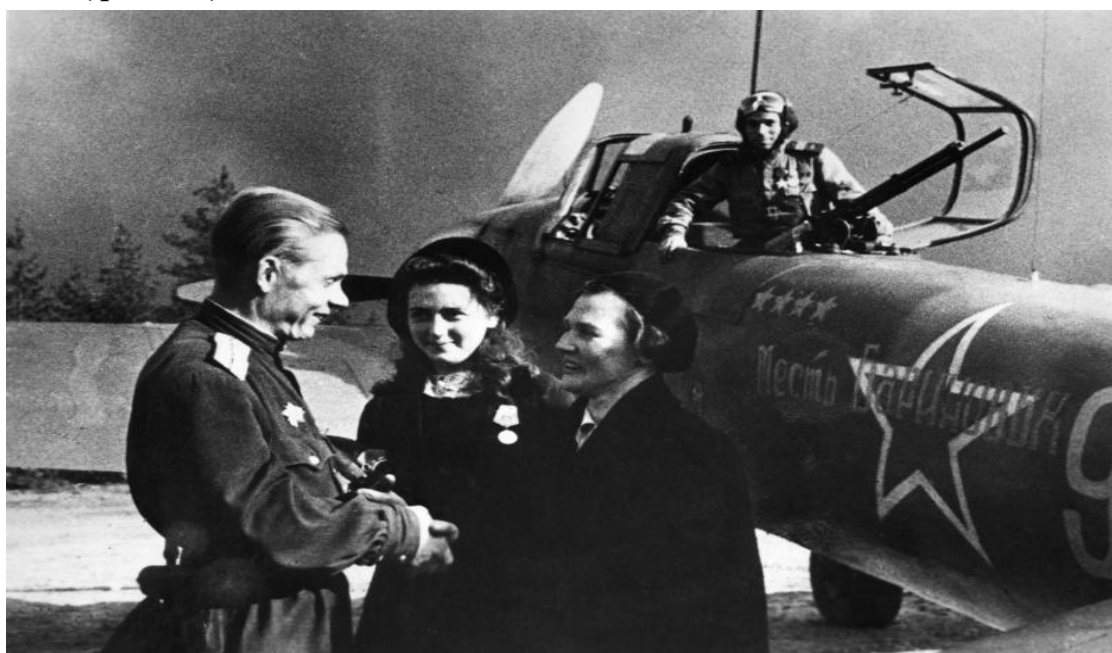
Фото 9. Подарок учащихся. 1944 год

Коллективы училищ и школ ФЗО активно участвовали в работе по созданию фонда обороны. Основная часть средств, перечисленных в фонд обороны, была заработана учащимися во время воскресников. Только в течение одного дня – 12 января 1943 года учащиеся Новосибирской области сдали в госбанк 44565 рублей для строительства эскадрильи «Трудовые резервы». (фото 9.)