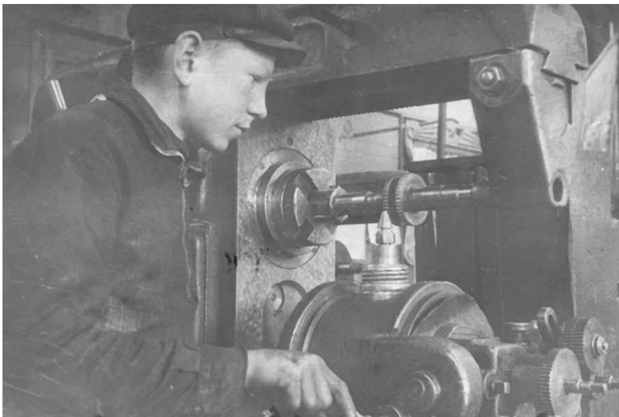
Фото 4. Токарная мастерская. 1943 год

Чтобы создать наиболее благоприятные условия для подготовки молодых рабочих, в училищах и школах ФЗО укрепляли материально – техническую базу (создавали учебно – производственные мастерские с токарными, слесарными, кузнечными и другими цехами) (фото 4.). В Кемеровской области такие мастерские были созданы во многих школах ФЗО. В них велось обучение более 50 % учащихся. Расширилась база производственной практики учащихся на производстве.