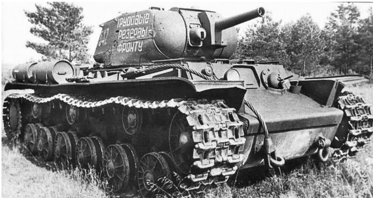
Фото 10. Подарок учащихся. 1944 год

Воспитанники системы трудовых резервов Кузбасса откликнулись на призыв своих товарищей из ремесленного училища №4 г. Москвы принять участие во всесоюзном воскреснике и перечислить заработанные деньги в фонд обороны. Отработав два дня, они перечислили заработанные средства на построение бригады танков. (фото 10.)