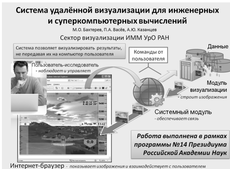
Рис. 1. Общая схема системы онлайн-визуализации

Как отмечено выше, когда возникает необходимость сгенерировать изображение, система вызывает зарегистрированную функцию рендеринга. Если пользователь инициирует изменение параметров, то происходит обновление значений соответствующих переменных в оперативной памяти модуля визуализации.