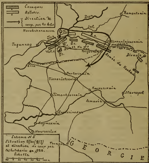
Схема N 5. Положеніе 27 декабря 1919 г. (9 января 1920 г.) и направленіе удара большевиковъ въ 1920 г.

27 декабря (9 января) вся армія уже была на лѣвомъ берегу Дона,*) переправившись черезъ него съ колоссальными затрудненіями. Спасли положеніе лишь наступившіе морозы, которые снова прекратились, какъ только закончилась переправа. Природа помогла своимъ сынамъ.