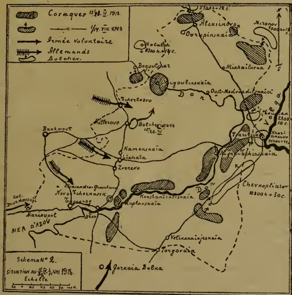
Схема № 2. Положеніе 15 (28) апрѣля и 1 (14) августа 1918 г.

сѣверной. На лѣвомъ берегу Дона, между нимъ и ж. д. Ростовъ—Тихорѣцкая, организовалась Задонская группа. Общее руководство принялъ ген. Поповъ, какъ походный атаманъ. Имѣлись свѣдѣнія, правда неточныя, о движеніи на Новочеркасскъ съ сѣвера со стороны Воронежа и съ запада со стороны Бахмута либо нѣмцевъ, либо украинцевъ, а также были точныя вѣсти о приближеніи съ юга съ Кубани Добровольческой арміи, что сильно ободрило Донцовъ.