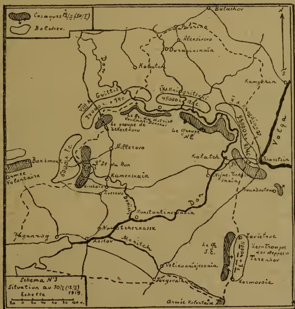
Схема N 3. Положеніе 30 января (12 февраля) 1919 г.

Необходимо отмѣтить, что развалу казачества на Воронежскомъ направленіи сильно помогла попытка Донского атамана организовать на этомъ направленіи, такъ называемую, „Южную армію“. Туда, какъ выяснилось особымъ разслѣдованіемъ,