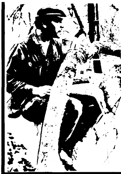
Боливийские горы. Че в дозоре.

Сменили людей на постоянном посту в старом лагере. Рубио и Аполинар сменили Карлоса и Врача. Уровень воды в реке по-прежнему высок, хотя и падает. Лоро ушел в Санта-Крус и еще не вернулся.