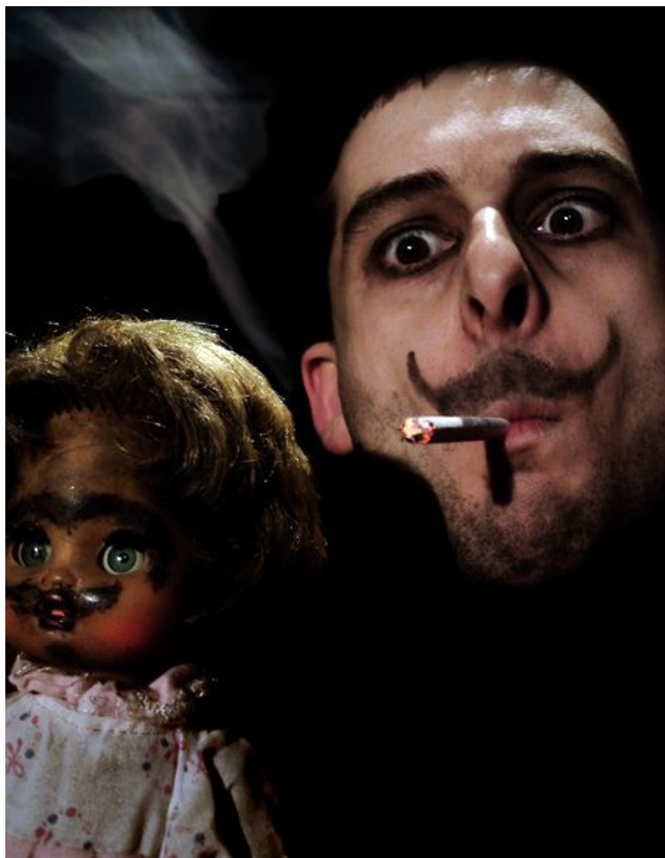
Автопортрет с Куклой