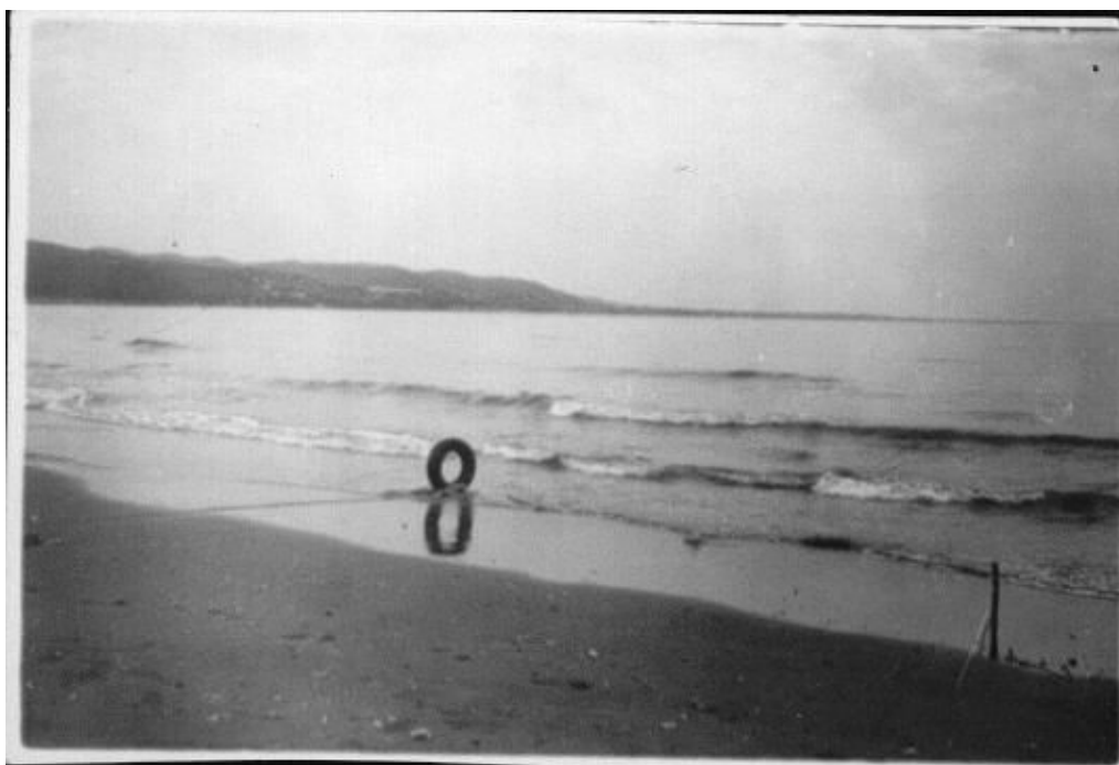
Сухуми. Прошлое – Будущее.