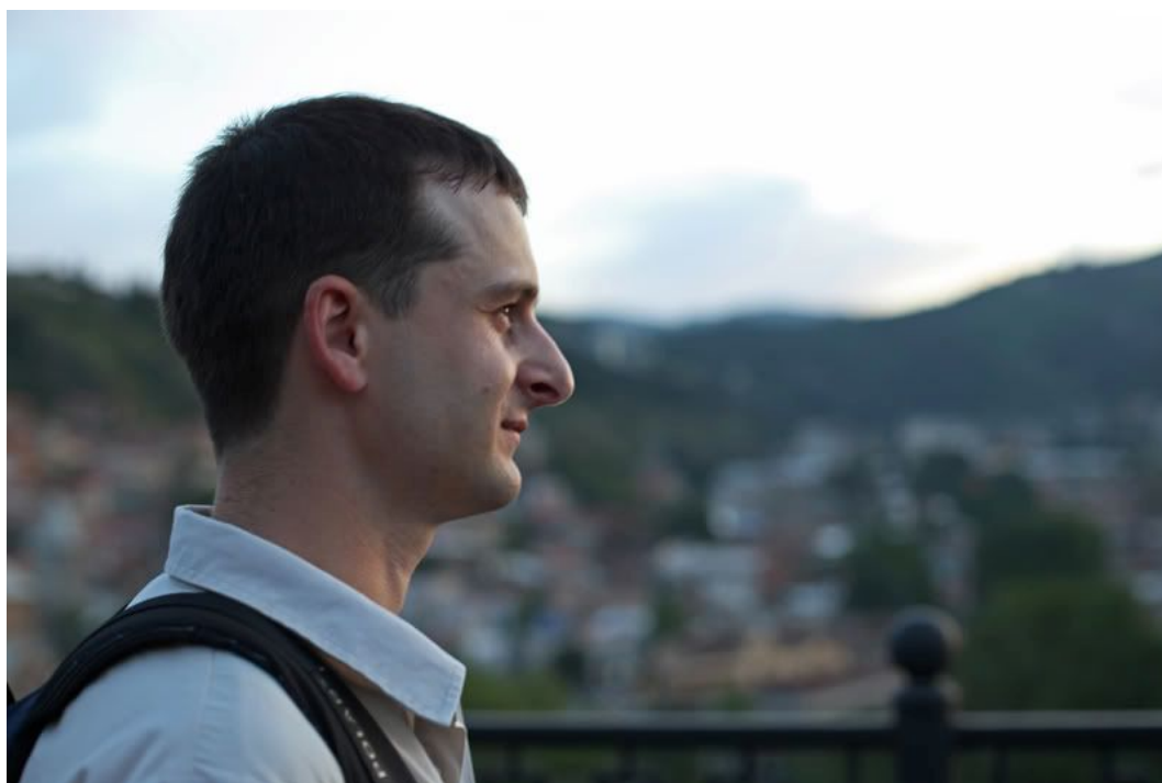
Встреча тбилисских блоггеров в ресторане „Копала,,.