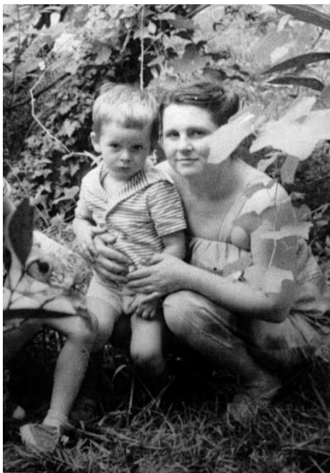
Родители. Я и Мама