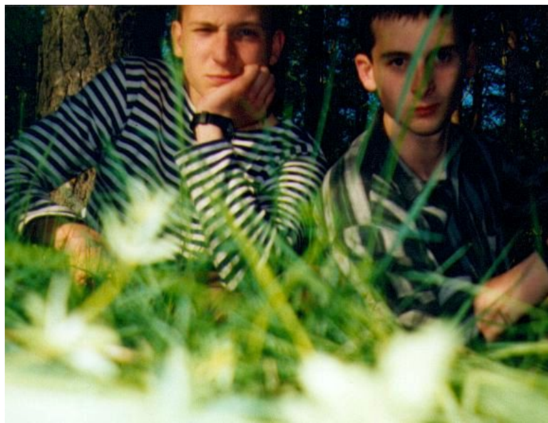
Друзья. На летней практике. СПб. Университет