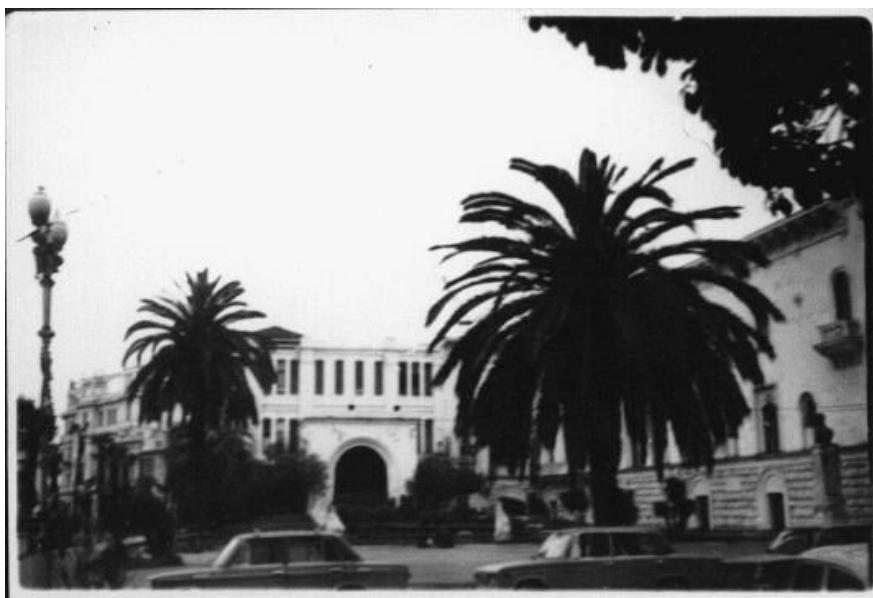
Детство. Сухуми.

Закончилась беседа. Получил большое удовольствие беседуя с нашим гостем. Честный и искренний человек. С разрешения Уважаемого Давида выкладываю немного фотографий. На мой взгляд они символичны. Ну и конечно Подарок. Без Подарка гостя нельзя отпускать. Надеюсь, что с выбором угадал.