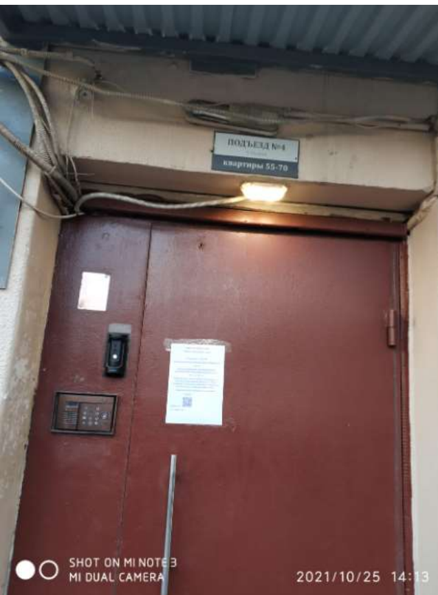
подъезды № 1, №2, №3, №4