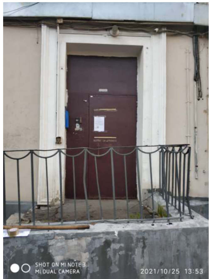
подъезды № 13, №14, №15, №15А