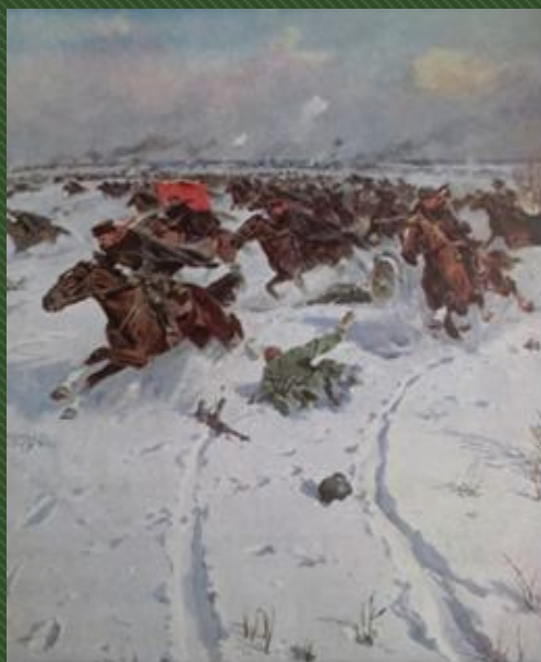
П. Кривоносов. СОВЕТСКАЯ КОННИЦА В БОЯХ ПОД МОСКВОЙ