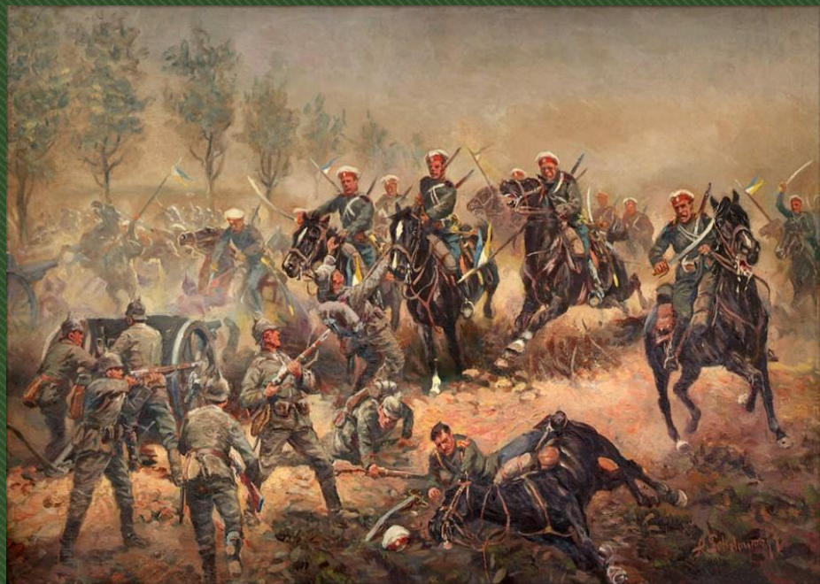
А. Шелоумов. ДОНСКИЕ КАЗАКИ АТАКУЮТ НЕМЕЦКИЙ АРТИЛЛЕРИЙСКИЙ РАСЧЕТ ВО ВРЕМЯ ПЕРВОЙ МИРОВОЙ ВОЙНЫ