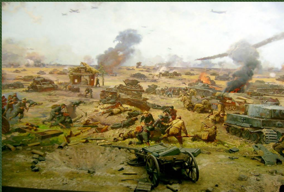
Н. Присекин. Диорама КУРСКАЯ БИТВА