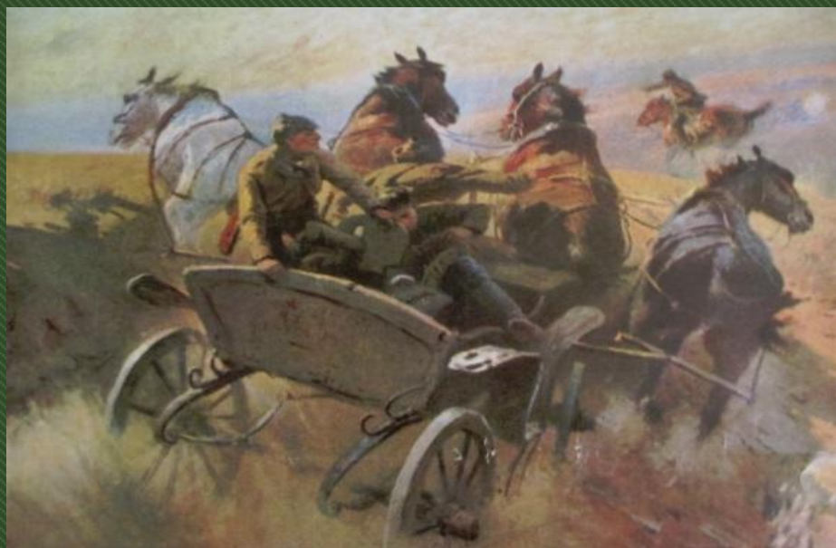
М. Греков. КОНАРМЕЙСКАЯ ТАЧАНКА