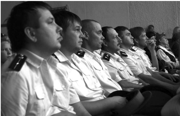
Зал был полон.

— Казаки генетически предрасположены к армии и служат с усердием, они нужны на Кавказе, также могут служить на границе — например, на Дальнем Востоке, из них лучше формировать легкие бригады. При наборе контрактников лучше отдавать приоритет казакам, и при формировании военной полиции я бы сделал ставку на казачество.