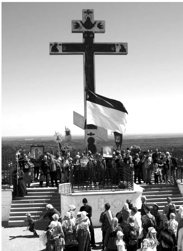
Паломники у Царского креста.

— Люди очень уставали: в ночное время мы охраняли их сон, заступали на дежурство с вечера и, подменяя друг друга, патрулировали территорию палаточного городка. Когда богомольцы заходили в храм, казаки сле-