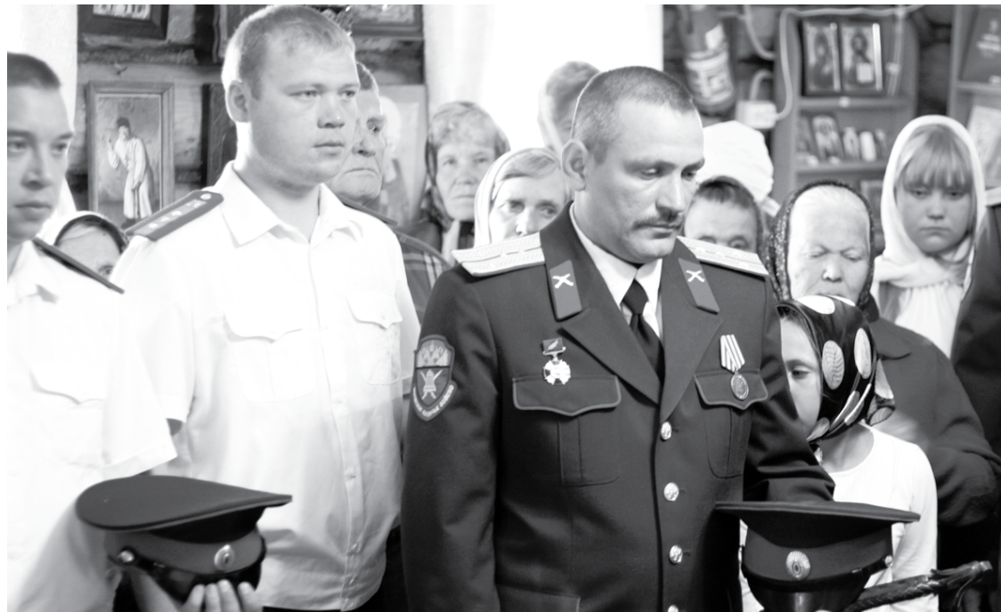
На богослужении в храме Иоанна Предтечи.

устройством на работу. Многие, конечно, ездили на заработки в Пермь. В свободное время в основном отдыхали с водочкой... Молодым тоже заняться особо было нечем, поэтому, закончив школу, они старались уехать в Пермь и там закрепиться.