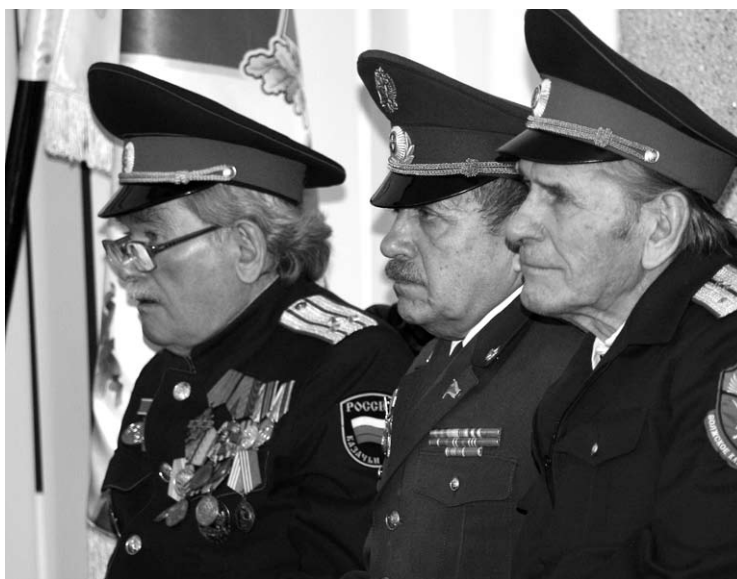
Хранители казачьих традиций.

Кубанские старожилы вспоминают: «Видят тебя или нет сидящие или идущие старики – надо снять шапку или поклониться, поприветствовать». Распоряжения старших выполнялись беспрекословно. Ко всем старикам, включая и родителей, обращались только на «вы». По обычаю, нельзя было окликать впереди идущего старшего, если требовалось что-то сказать, а следовало догнать старшего и, поравнявшись, обратиться к