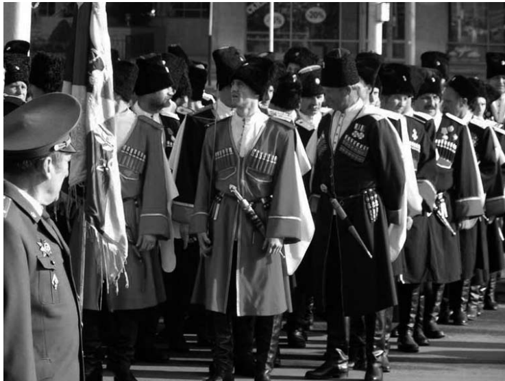
Казаки — это сила!

Министерство обороны РФ намерено активнее привлекать представителей казачества к службе в армии. Об этом газете «Известия» рассказал начальник Генштаба Вооруженных Сил РФ Николай Макаров. По его словам, подразделение казаков может появиться в каждом военном округе.