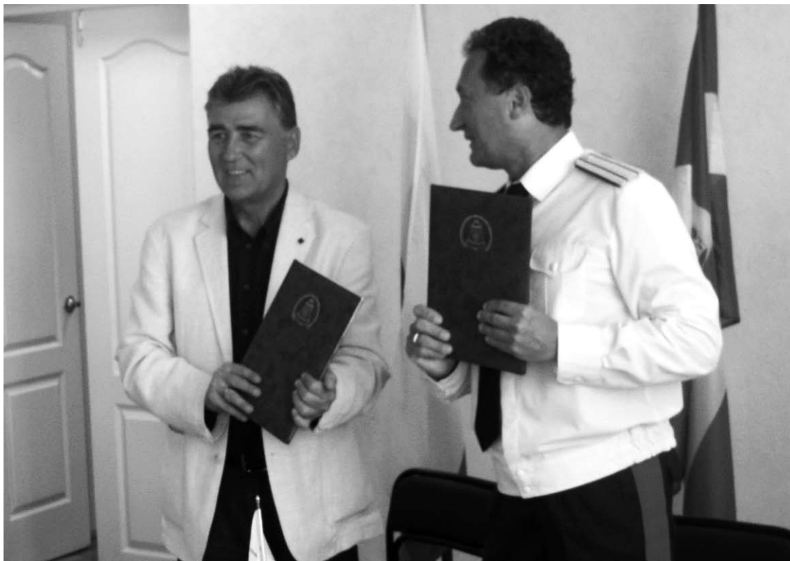
Сотрудничество закреплено документально.