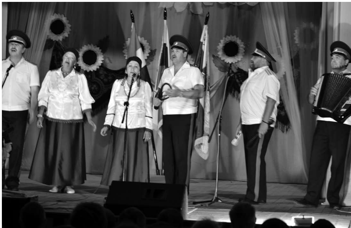
Мокинцы со сцены приветствуют казаков.

— Братья казаки! Сегодняшний фестиваль — знаковое мероприятие, итог нашей общей работы в составе СЗКО. Круглый стол в рамках фестиваля — отличная возможность поговорить о том, что одинаково волнует всех нас. Здесь, в сплочённом казачьем кругу, мы можем обсудить направления развития нашего общества, выяснить, что нам мешает. Руководство СЗКО не может принимать важные решения, касающиеся всего прикамского казачества, не зная воли атаманов.