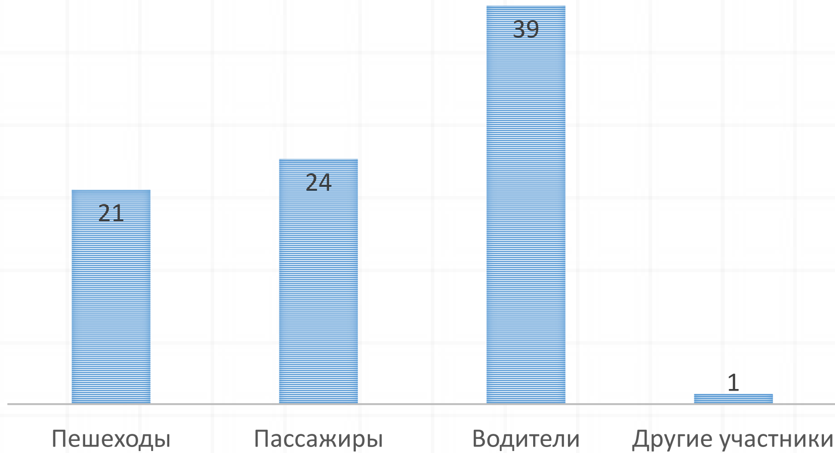
■ Погибшие по категориям