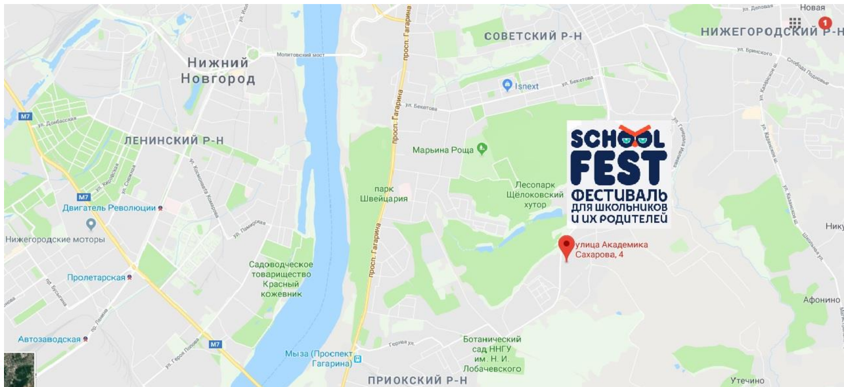
Схема проезда до фестиваля SCHOOL FEST: