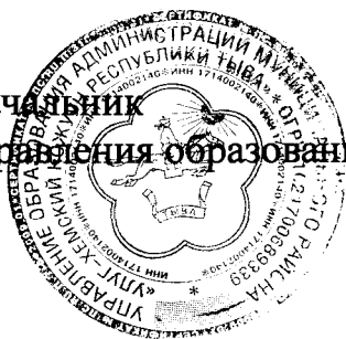
О. Б. Сенти