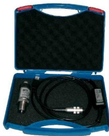
Транспортный чемодан с СРТ2500 и USB-адаптером