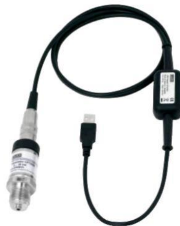
Преобразователь давления Модель CPT2500 с USB-адаптером Модели CPA2500