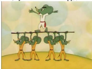
«Хлеб», © Беларусьфильм, 1984 г. Длительность: 8 мин. 35 сек.

Вывод: Кот Базилио во время работы зазнался, и ему нашли замену. Чтобы не потерять работу и общественное признание, нужно постоянно трудиться.