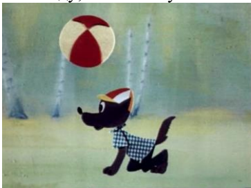
«История с единицей», © Киевнаучфильм, 1975 г. Длительность: 8 мин. 52 сек.

Вывод: Маленькие футболисты не умели читать, поэтому играли около болота и попали в беду. Чтобы больше не попадать в беду, они стали учиться читать.