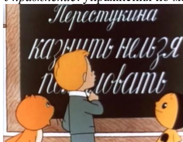
«Опять двойка», © Союзмультфильм, 1957 г. Длительность: 20 мин. 8 сек.

Упражнение: упражнения по математике, весёлые задачки.