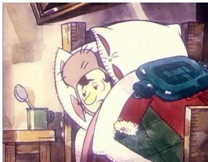
«Ох и Ах идут в поход», © Союзмультфильм, 1977 г. Длительность: 9 мин. 37 сек.

Цель: формировать представление о том, что отсутствие труда и позитивных целей приводят к серой, скучной жизни и слабому здоровью.