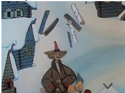
«Лиса-строитель», © Союзмультфильм, 1950 г. (по басне И.А. Крылова) Длительность: 9 мин. 53 сек.

Вывод: Емеля получил волшебное кольцо, с помощью которого ему ничего не надо было делать самому. Но на это кольцо сразу возникло много желающих. И решил Емеля, что лучше всё делать самому, ведь этого качества у него никто не отберёт.