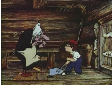
«Вася Буслик и его друзья», © Беларусьфильм, 1973 г. Длительность: 8 мин. 44 сек.

Цель: формировать представление о том, что знания и умения необходимы, чтобы не попасть в беду.