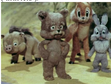
«Старые знакомые», © Союзмультфильм, 1955 г. Длительность: 20 мин. 19 сек.

Вывод: Медвежонок хотел стать сильным и ловким, поэтому тренировался. Большое желание и тренировки помогли ему стать сильным. Чтобы получить результат, нужно поставить цель ("захотеть") и тренироваться ("попотеть").