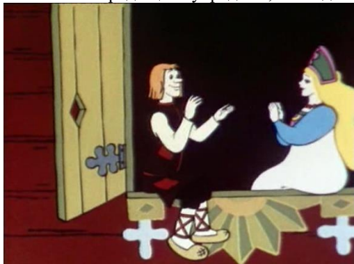
«Кот Базилио и мышонок Пик», © Киевнаучфильм, 1975 г. Длительность: 8 мин. 55 сек.

Вывод: Иван, чтобы добиться цели, трудился. А Полкан, чтобы добиться той же цели, украл. Иван добился цели, а Полкан нет. Если ради цели украдешь, то не добьёшься ничего.