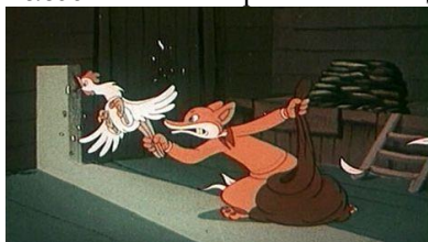
«Зайка-заснайка», © Союзмультфильм, 1974 г. Длительность: 16 мин. 31 сек.

Вывод: Лиса обхитрила Льва. Он думал, что она решает его задачу, а оказалось, что она решает свою задачу.