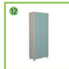
12 Шкаф для документов -1шт.