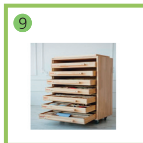
9 Развивающий набор психолога «Приоритет» 7 модулей- 1 комплект.