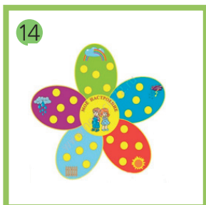
14 Стенд обучающий Мое настроение.