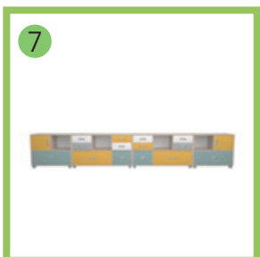
7 Тумба под школьную доску 1 -1шт.