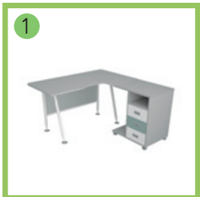
1 Стол эргономичный с приставной тумбой-1 шт.