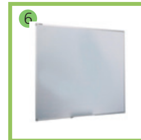
6 Доска магнитно-маркерная.