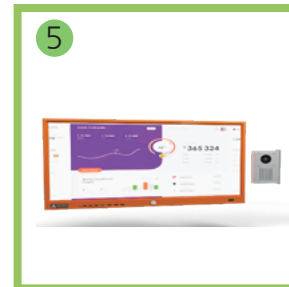
5 Интерактивная панель - 1 комп.