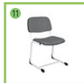
11 Стул ученический мягкий ростовой, ростовая группа 5 - 6 шт.