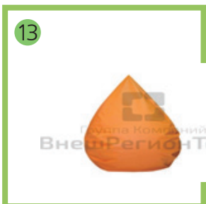
13 Кресло-мешок для релаксации капля большая — 2шт.