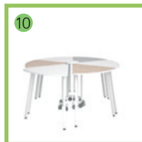
10 Стол-трансформер "Оригами", ростовой. -1 комплект.