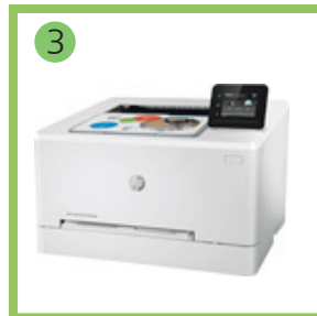
3 Принтер лазерный цветной — 1 шт.