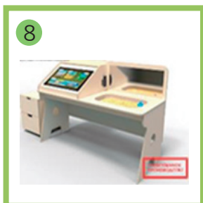
8 Профессиональный интерактивный стол психолога-дефектолога - 1 комп.