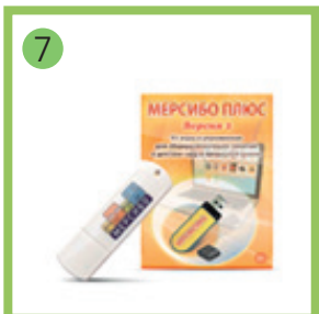
Программно-дидактический комплекс "Мерсибо Плюс" - 1 комп.