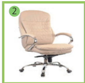
Компьютерное кресло (взрослое)- 1шт.