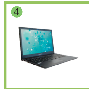
Ноутбук Aquarius SMP NS685 (Исп.4.3).