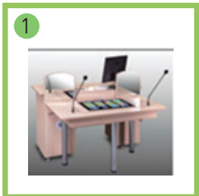
Интерактивный комплекс «Стол логопеда».