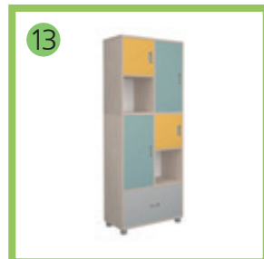
МОДУЛЬ 2X5.1- 1 шт.