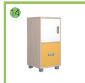
МОДУЛЬ 1X2- 2 шт.