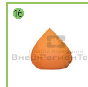
Кресло-мешок для релаксации капля большая — 2шт.