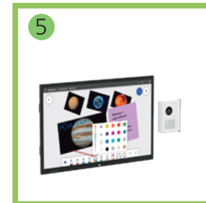
Дублирующий дисплей - 1 комп.