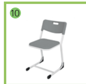
Стул ученический регулируемый (ЛП/1.1.).