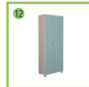
Шкаф для документов -1шт.