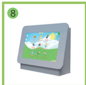
Мобильный логопедический комплекс - 1 комп.