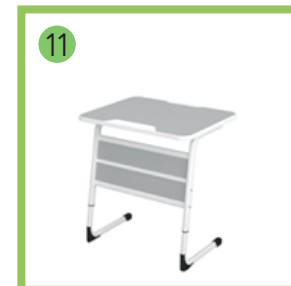
Стол односторонний регулируемый (ЛП /1) -4 шт.