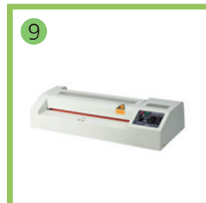
Устройство ламинации тестовых материалов - 1 шт.